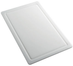
HPDE 砧板 8657 001